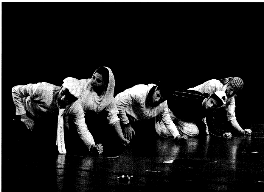
„Wir, das ist das, womit ich lebe“, Anfangssequenz

„Wenn wir keine Sehnsucht mehr haben, sterben wir.“ „Über den Krieg habe ich Gott verloren.“ „Stirbt die Erinnerung, stirbt der Tod.“ „Die Freiheit der Frau liegt in der Distanz des Mannes.“