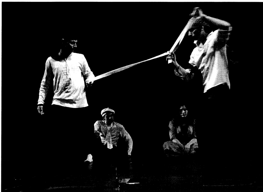
Das Ringen in der Gruppe wird auf die Bühne gebracht

mehr wichtig, jeder wird gesehen wie er ist. Wir wollen jetzt weiterarbeiten, das Stück ausbauen.“ Kulturelle Zuschreibungen sind nun nicht mehr von emotionaler Bedeutung, nicht mehr Sinn stiftend. Der persönliche Sinn lag nicht mehr in der Suche nach trennenden Unterschieden, sondern in der subjektiv unterschiedenen Deutung von Gemeinsamkeiten. Während der Proben, in Improvisationen und Pausen finden die Jugendlichen zueinander: Sie agieren miteinander – körperlich.