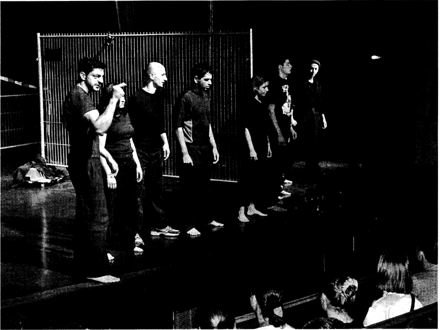
Aufführung von „Der Edelste Teil“ im Juni 2000, Theatersaal Berufliche Schule H20

Herausragend für die Motivation meiner Theaterschülerinnen und -schüler ist die langjährige Zusammenarbeit mit professionellen Theatern (hier vor allem das Ernst-Deutsch-Theater), der Körper-Stiftung Hamburg (Theater und Schule (TuSch) -Projekte) und den Theaterpädagogen Wolfgang Sting und Irinell Ruf. Hier erleben die jugendlichen Schauspielerinnen und Schauspieler einen Wechsel ihrer Perspektiven und entwickeln neue Wahrnehmungs- und Verhaltensmuster. Sie profitieren von professionellen Rahmenbedingungen am Theater, kommen in Kontakt mit Theatermacherinnen und -machern und erleben eine ganz andere Wertschätzung ihrer Persönlichkeit als Schülerin bzw. Schüler.