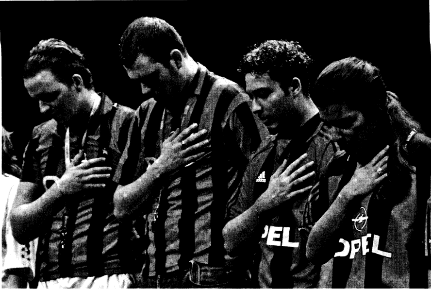
„Erfolgsgebet“ der Milanistas, Kampfnagel Kulturfabrik, Juni 2005

die nicht nur die Figuren aggressionsbereiter Fans und ihre gruppendynamischen Prozesse betrachten und widerspiegeln sollte (wie in der Inszenierung von Nübling „I Furiosi“). Uns interessierte auch die Rolle der beteiligten Spieler, Trainer und die des Spielleiters. Mit Texten von W. Schmidt und M. Schulze „Der Schlachtenbummler“, Original-Spielberichten unterschiedlicher Profiligen und Balestrinis Texten aus „I Furiosi“ entwickelten wir Figuren und einen „roten Faden“ für die Spielhandlung. Zentrales Requisit war ein großes fahrbares Gerüst, das als Tribüne und Fanbus eingesetzt wurde. Chorische Fangesänge und Auftritte einzelner Fans wechselten mit Reportagen aus dem Megafon und einzelnen Spielszenen, in denen wir Empfindungen nachspürten, wie es sich denn anfühlt, als „zwölfter Mann auf dem Feld“ seine Zerstörungswut und menschliche Demütigungen auszuleben. Obgleich persönlich nicht in der Fußballszene engagiert, überzeugten die jugendlichen Schauspieler aus dem Iran, Irak, Vietnam, Serbien-Montenegro und Deutschland durch leidenschaftliche Spielfreude und große Authentizität auf der Bühne.