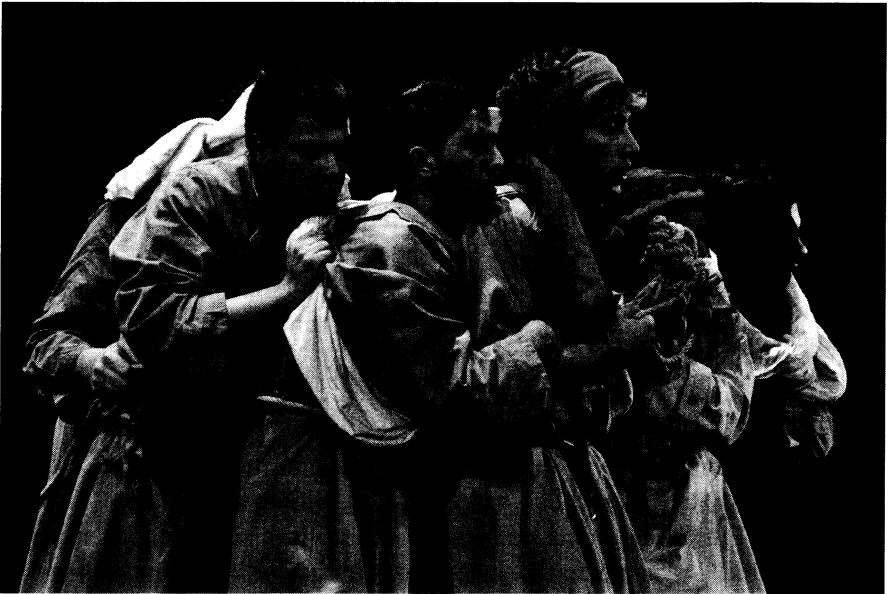
„Sein im Nichtsein“, Flüchtlingstreck Plattformfestival 2007, Ernst Deutsch Theater Hamburg

„mich viele Szenen persönlich berührt (haben). Wie kann ich das genauer beschreiben? In knapper und schlichter Form entsteht Szene um Szene mit einem für Schülertheater erstaunlich künstlerischem Know How mit Konzentration, Ehrlichkeit und klarer Sachlichkeit. Den Schülern gelingt eine Gratwanderung zwischen Anteilnahme und Zurückhaltung. Ihre Figuren erzählen ihre Fluchtgeschichte als ein Stück der Parallelwelt, die wir sonst oft nicht wahrnehmen. (...) Wie in einem Spiegel nach innen sehe ich die Figuren neu, wenn sich Beziehungen zwischen Männern und Frauen auf der Bühne entwickeln. Liebende, die immer wieder gestört aufeinander los gehen, weil erlittenes Unrecht, Traumatisierungen und Gewalterfahrungen auf der Flucht die Seele der Liebenden zerschunden haben. (...) Sie spielen, um die Wirklichkeit darzustellen. Nicht in erster Linie, um Zuschauer zu unterhalten oder ethischer Zeigefinger zu sein. Gerade dadurch erzielen sie eine große Wirkung, wird das Stück für mich zu einer Ode an die Menschlichkeit und Humanität in unserem Land.“